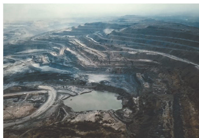
La mine de charbon Cerrejón de Glencore en Colombie

L'immense mine de Cerrejón pose des problèmes majeurs à la population du département de La Guajira. Son expansion continue conduit à de multiples déplacements forcés. Des produits chimiques et des métaux lourds polluent l'eau et les sols, empêchant pratiquement toute culture agricole. L'extraction du charbon provoque une forte pollution atmosphérique, aux particules fines notamment, entraînant chez les riverains des problèmes de santé tels que maladies cutanées,