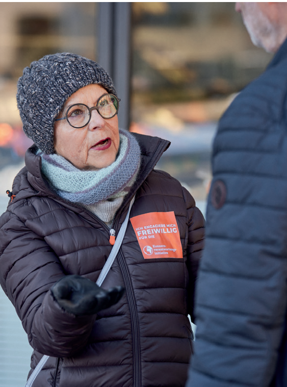
Des bénévoles ont récolté les signatures nécessaires en un temps record sur plus de 1000 stands.

nous avons pu récolter très rapidement 183 661 signatures, beaucoup plus que ce que nous n'aurions jamais imaginé. Cette récolte record démontre à quel point le thème de la responsabilité des multinationales est important pour la population. Elle prouve aussi la force et l'engouement pour notre mouvement. En poursuivant notre engagement collectif, nous avons toutes les chances de remporter la prochaine votation !