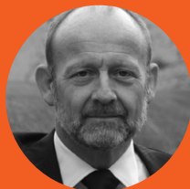
Dominique de Buman Ancien conseiller national Le Centre