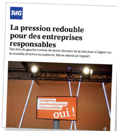
Tribune de Genève, 1 juin 2024

Peu après l'adoption de la directive européenne, un comité composé de personnalités politiques du Centre, du PLR, du PEV et des Vert'libéraux ainsi que de nombreux entrepreneurs et entrepreneuses a lancé l' Appel pour des multinationales responsables . Cet appel vise à donner davantage de visibilité aux revendications adressées au Conseil fédéral et au Parlement en matière de responsabilité des multinationales. Il demande que la Suisse prenne des mesures concrètes dans ce domaine et adopte des règles alignées sur celles de ses pays voisins.