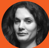
Silva Lieberherr Multiwatch