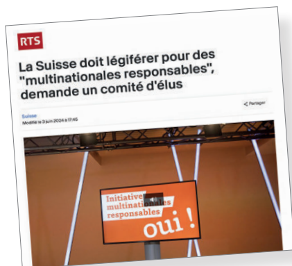
RTS, 3 juin 2024

Dans le cadre de l' Appel pour des multinationales responsables , un large comité s'est adressé aux médias durant l'été 2024.